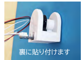
裏に貼り付けます

3 「くるくるセンサーキット」から左画像のパーツを取り出し、シャフト先端に取り付けます。さらに、ビー玉が当たった時に回転するようなパーツを両面テープを使って貼り付けましょう。