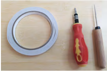
両面テープ ドライバー 千枚通し