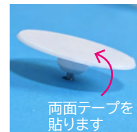
両面テープを貼ります